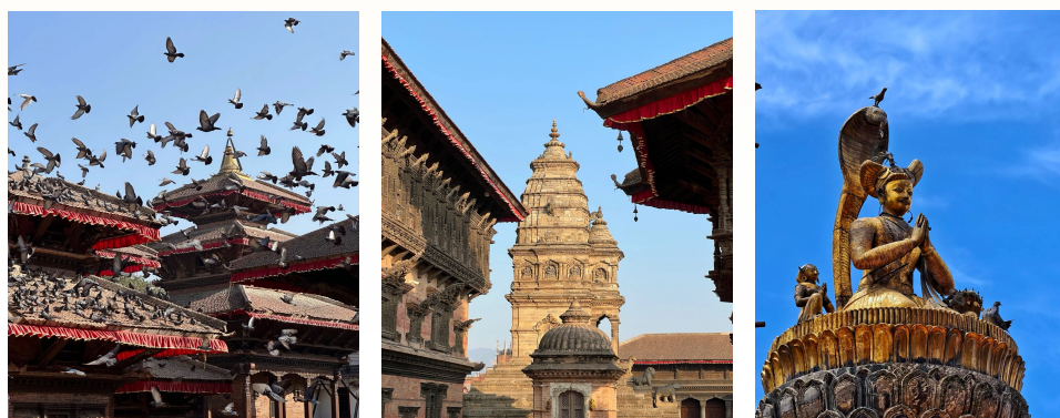
杜巴广场 (王宫广场)