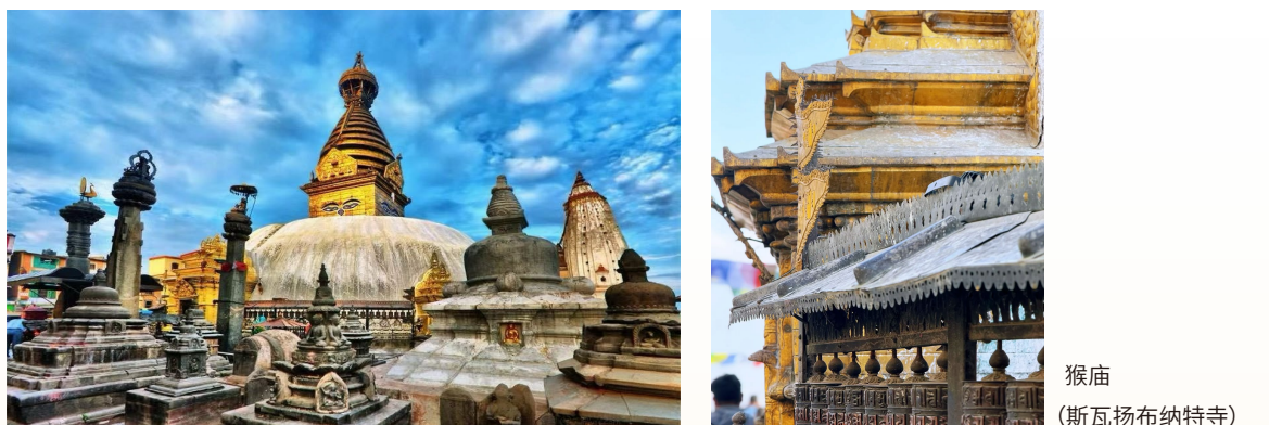
猴庙 (斯瓦扬布纳特寺)