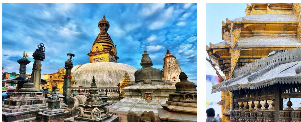
猴庙 (斯瓦扬布纳特寺)